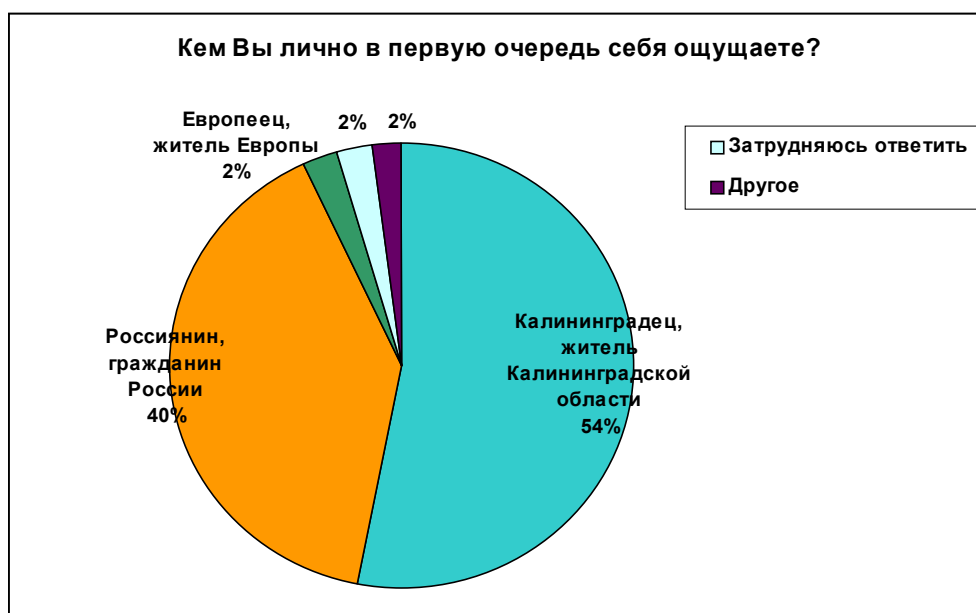
Диаграмма 2.3.1. Самоидентификация населения Калининградской области

Анализ данных показал, что большинство участников опроса (54%) воспринимают себя в первую очередь калининградцами, жителями Калининградской области . В подгруппе респондентов, родившихся в Калининграде, эта доля выше – 61%; среди мигрантов (приехавших в область из других регионов), напротив, ниже – 45%. Доля тех, кто прежде всего считает себя россиянином, гражданином России, составляет 40%. «Европейцев» («жителей Европы» по самовосприятию) среди респондентов оказалось немного – всего 2% (см. диаграмму 2.3.1). При этом почти вдвое чаще, чем жители области в целом, воспринимают себя «европейцами» молодежь (от 16 до 24 лет) и граждане с высоким уровнем материального положения. А представители старших возрастных групп (старше 55 лет), напротив, чаще считают себя россиянами, гражданами России; это понятно – 90% респондентов из этой возрастной категории являются мигрантами (т.е. родились в других регионах России или республиках бывшего СССР).