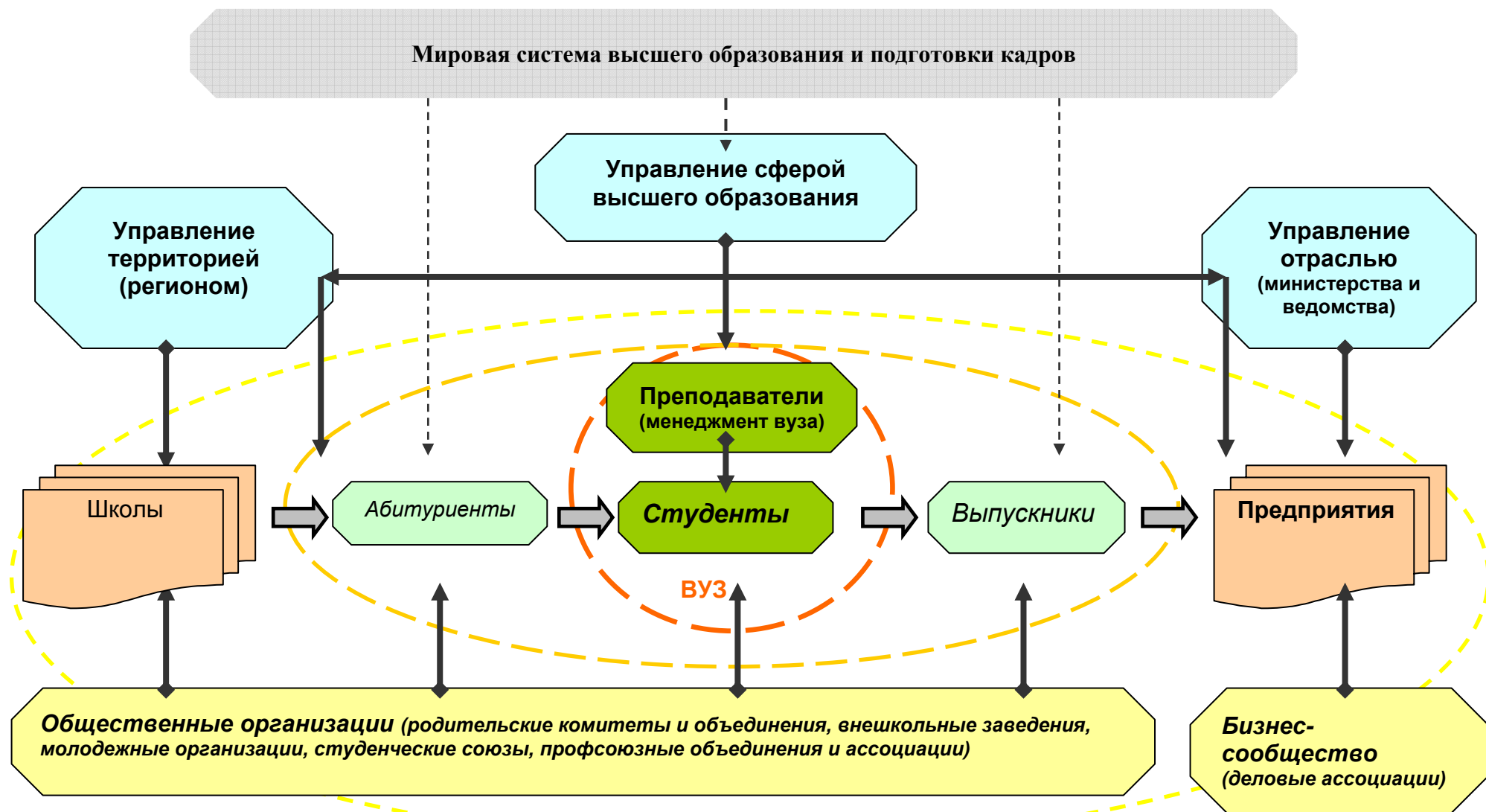
Рис. 1. Схема взаимодействия ВУЗа с различными стейкхолдерами