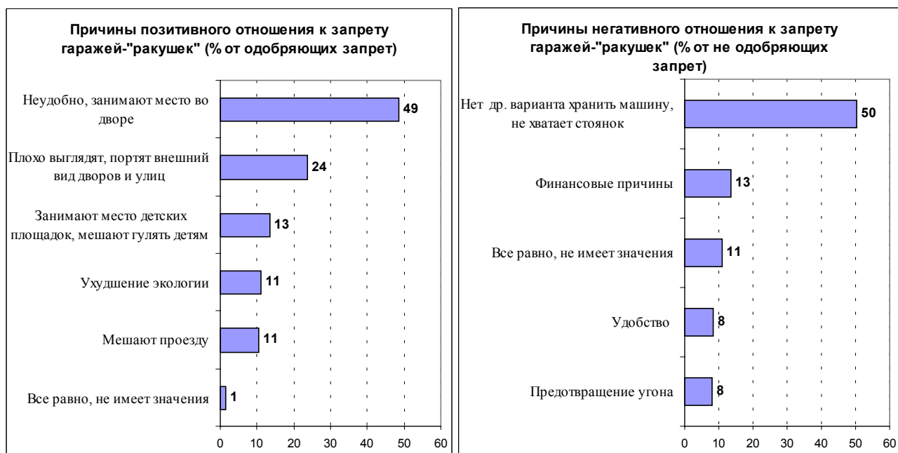
Диаграмма 4. Почему Вы относитесь к намерению запретить гаражи-«ракушки» именно так?

Существенных различий в мотивации отношения к запрету «ракушек» в группах респондентов из семей, имеющих и не имеющих автомобили, не зафиксировано. Отметим дополнительно, что владельцы гаражей-«ракушек», выступающие в поддержку их запрета, естественно, высказываются за то, чтобы взамен «ракушек» им был предоставлен другой вариант для парковки и хранения автомобиля.