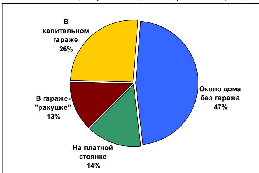
Диаграмма 2. Где Вы его (автомобиль) чаще всего держите (ставите)?

Анализ ответов респондентов на вопрос об условиях хранения и парковки автомобиля показал, что почти половина автовладельцев обычно оставляет свой автомобиль «около дома без гаража» (47%). Каждый четвертый москвич, имеющий автомобиль, держит его в капитальном гараже (включая подземные и многоэтажные гаражи); 14% оставляют свой автотранспорт на платных стоянках. В гаражах-«ракушках» держат автомобиль 13% автовладельцев (см. диаграмму 2).