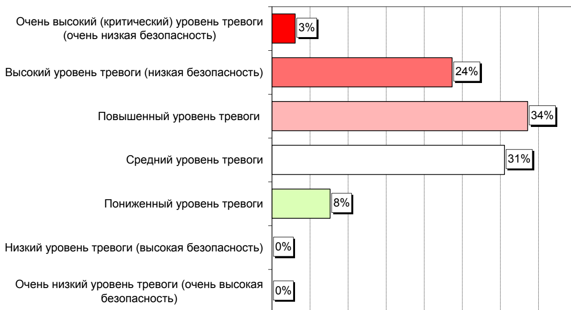
Рис. 1.1. «Если говорить о российской национальной безопасности в целом, на каком уровне в настоящее время она находится? Какой уровень тревоги Вы объявили бы?»

Очевидно, что относительно невысокая оценка состояния национальной безопасности не имеет простой интерпретации и поэтому, учитывая остроту проблематики, должна стать предметом широкого обсуждения заинтересованными сторонами.