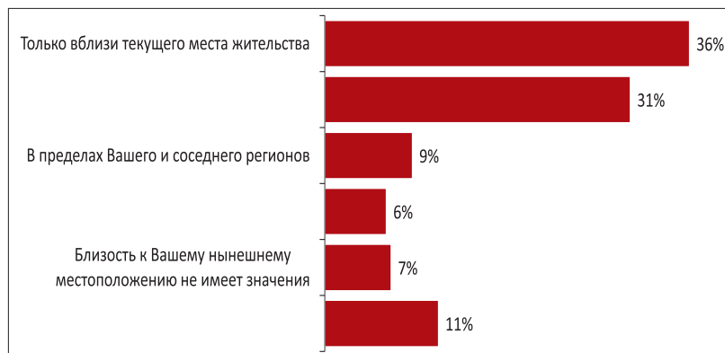
Рис. 3. «Переезд из города в сельскую местность для вас возможен...» (% от тех горожан, которые хотя бы задумывались о переезде из города в село)

По результатам сравнения ответов горожан и селян в целом можно констатировать, что жители российских городов и сел довольно одинаково представляют себе основные препятствия на пути миграции горожан в сельскую местность. Среди привлекающих стимулов для переезда горожан представители сельской местности наиболее часто выбирали стимулы материального характера: льготные условия покупки жилья и высокий уровень заработной платы на селе. Однако не менее значимым, по их мнению, является такой выталкивающий стимул, как ухудшение экологической ситуации в городе (в два раза менее распространенный у горожан на самом деле, то есть селяне преувеличивают значимость экологической проблематики для городского населения).