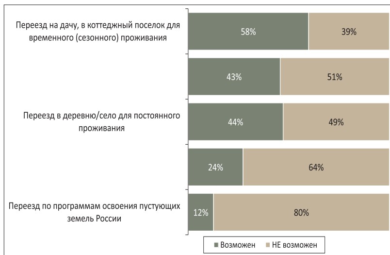
Рис. 2. «Какие из представленных вариантов вы рассматриваете для себя как возможные хотя бы в отдаленной перспективе, а какие считаете невозможными в принципе?» (% от тех горожан, которые хотя бы задумывались о переезде из города в село)

3) Незрелость сельской инфраструктуры, транспортная недоступность, отсутствие работы или небольшое количество вариантов занятости.