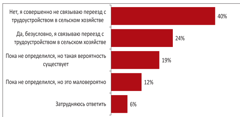
Рис. 4. «В случае переезда в сельскую местность рассматриваете ли вы возможность последующего трудоустройства в сельском хозяйстве?» (% от тех горожан, которые хотя бы задумывались о переезде из города в село)

Говоря о необходимых требованиях, предъявляемых к месту проживания (табл. 4), в первую очередь респонденты обоих типов выделяли учреждения здравоохранения . Жители городов заметно чаще, чем сельские, отмечали важность коммунальных услуг (электро-, водо-, газоснабжение). Сельское же население чаще городского выбирало учреждения образования, дороги и хорошее транспортное сообщение с городом как привлекательные для горожан условия.