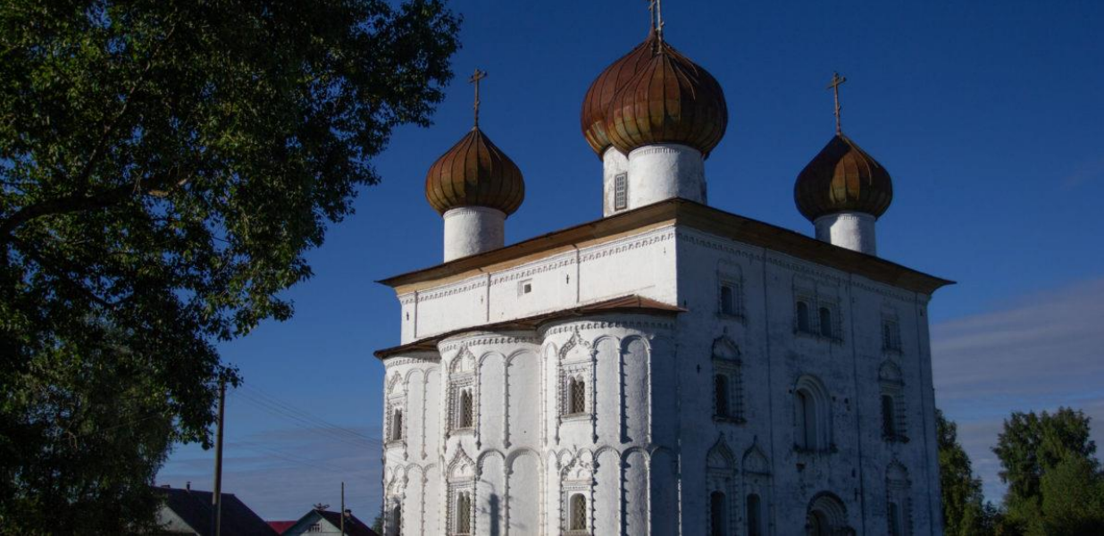
Благовещенская церковь в Каргополе Каргополь, Архангельская область