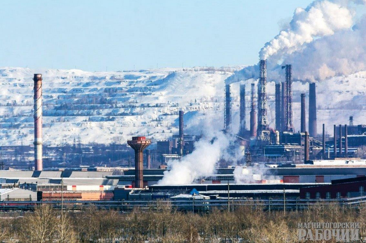
Магнитогорский металлургический комбинат Магнитогорск, Челябинская область