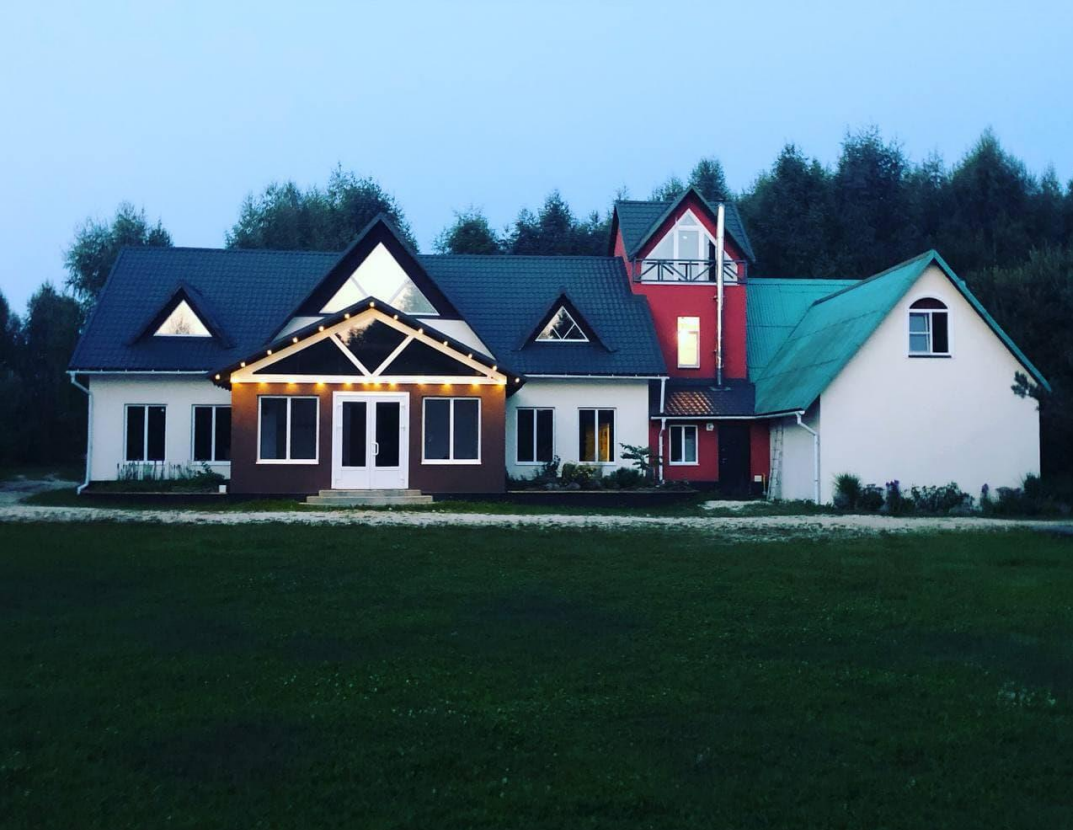
Социально-культурный центр Добрая земля Судогодский район, Владимирская область