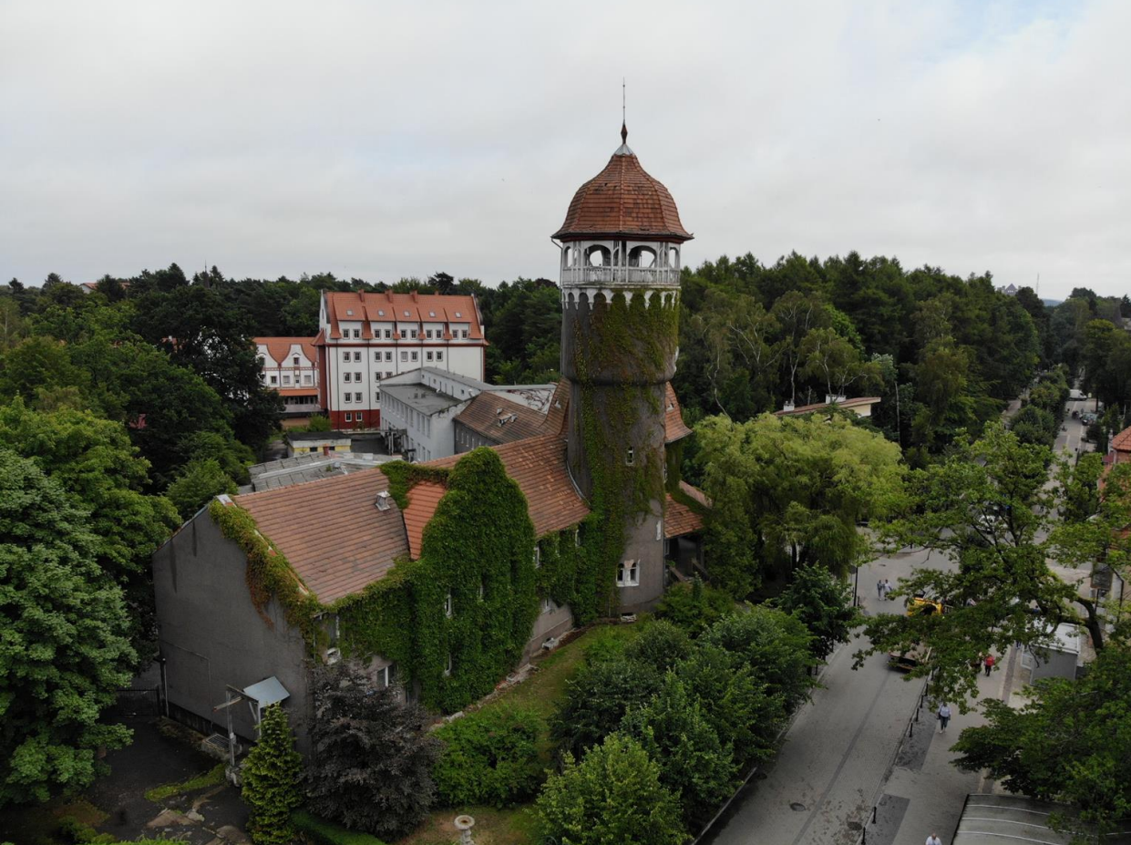
Водонапорная башня в Светлогорске Светлогорск, Калининградская область

*Cittaslow (Медленный город) - международное движение, основанное в Италии в 1999 году.