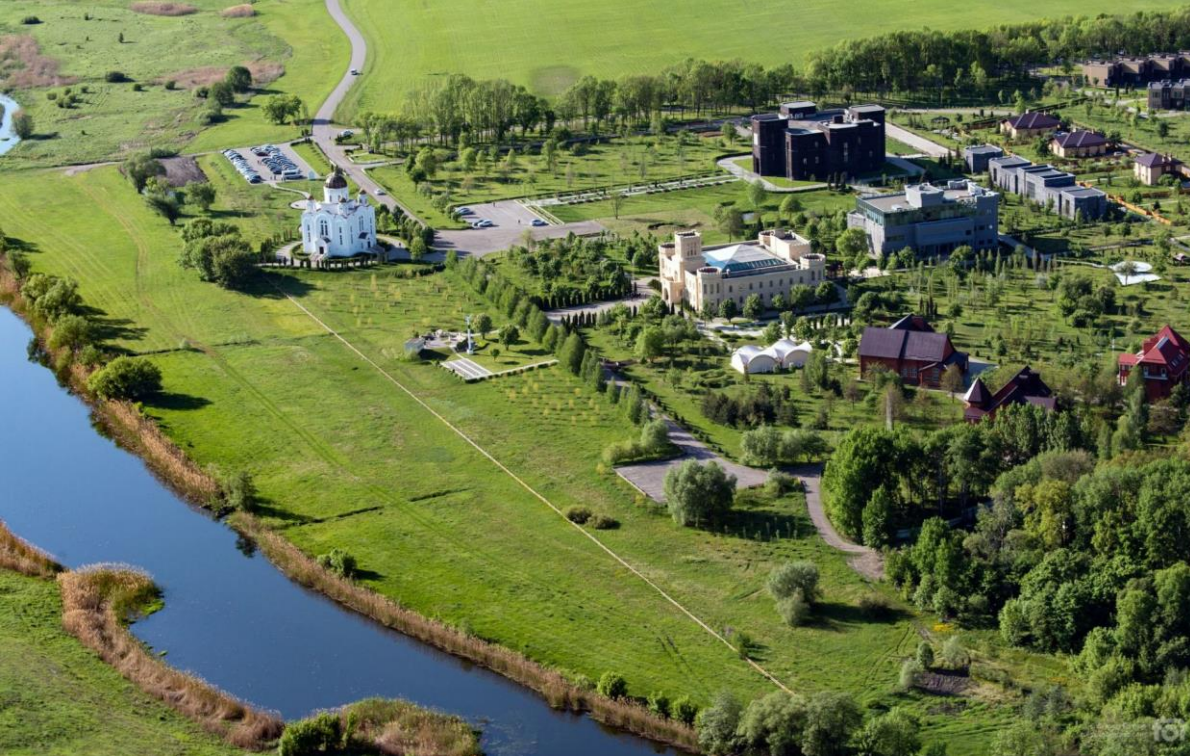
Научно-образовательный центр Бирюч, Белгородская область