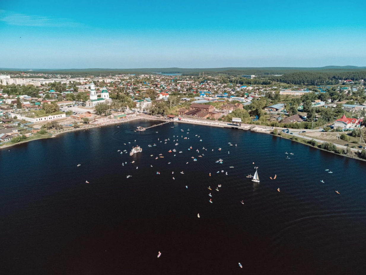
Сысерть, Свердловская область