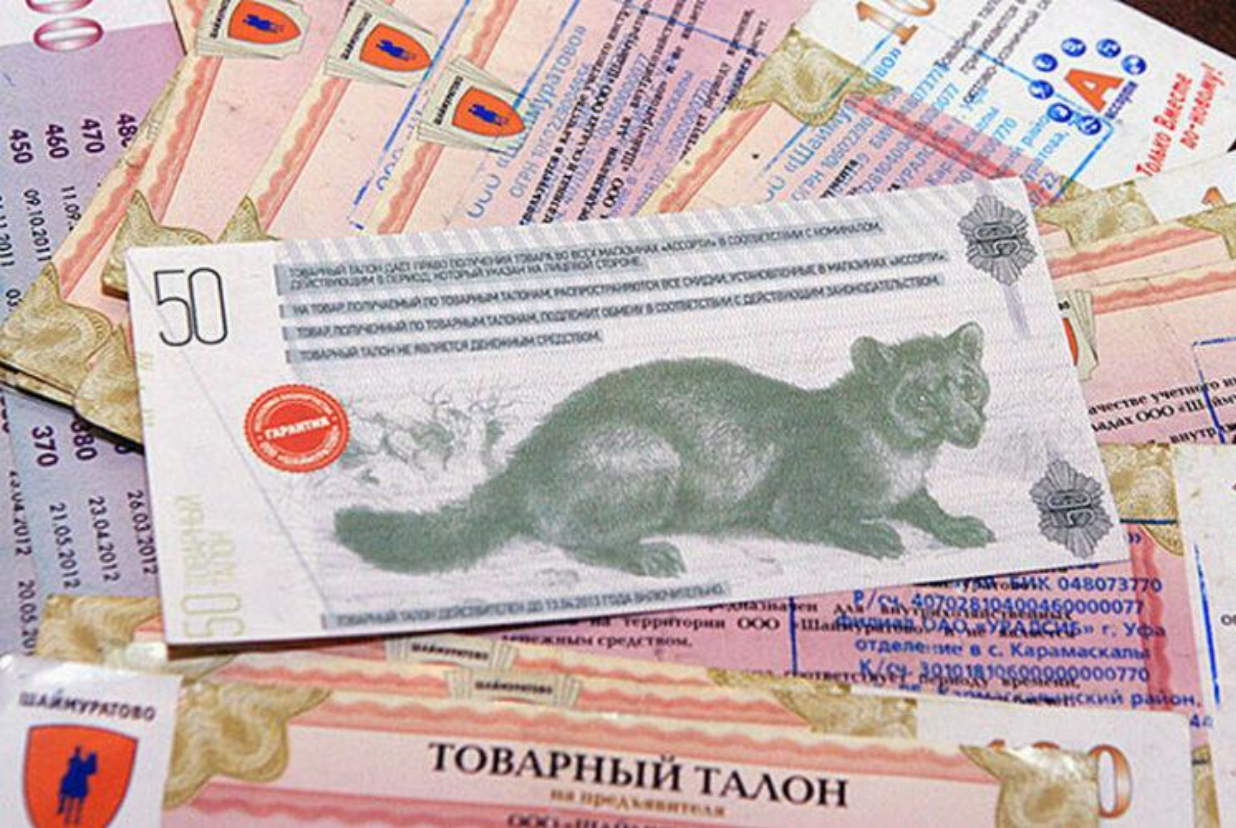
Товарные талоны Шаймуратики Шаймуратово, Республика Башкортостан