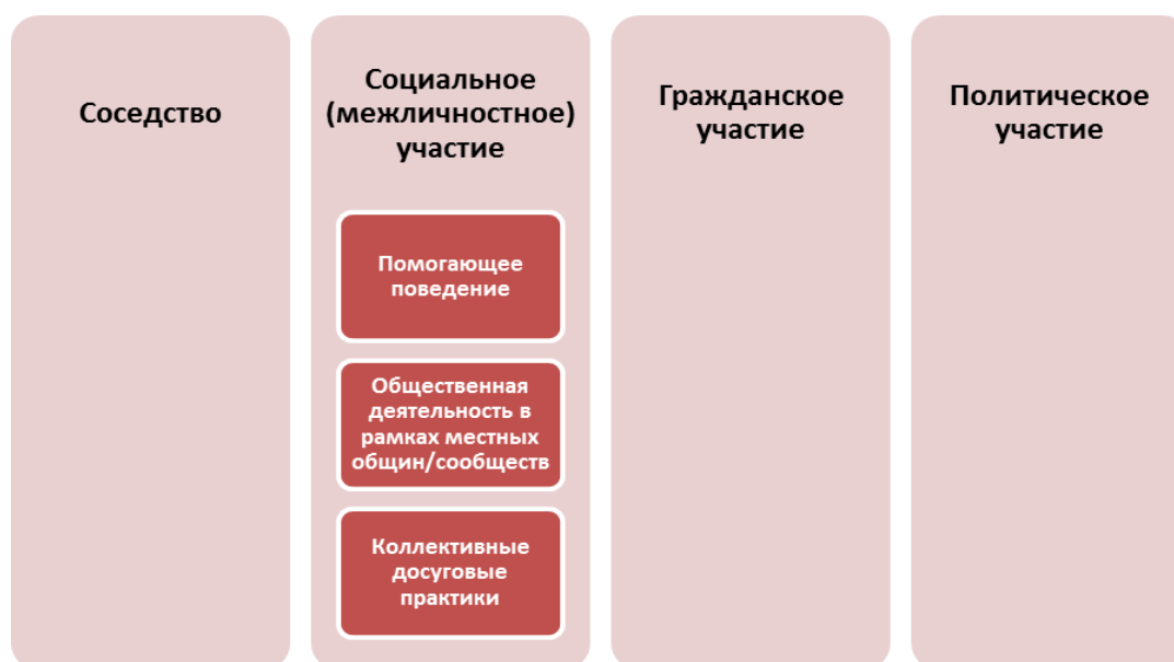
Рис. 1.1. Уровни социальной активности населения

Соседский уровень социальной активности (соседство) предполагает, что межличностное общение носит бытовой характер. Это множество случайных, спонтанных, непродолжительных контактов, связанных с повседневностью, ежедневными заботами, радостями и горестями. Обсуждение гражданско-политических тем не исключается, но и не ведет к каким-либо дальнейшим действиям. Из разрозненных жителей уже образуется некая социальная общность, в которой есть взаимное доверие, но еще отсутствуют крепкие социальные связи и серьезная самоорганизация.